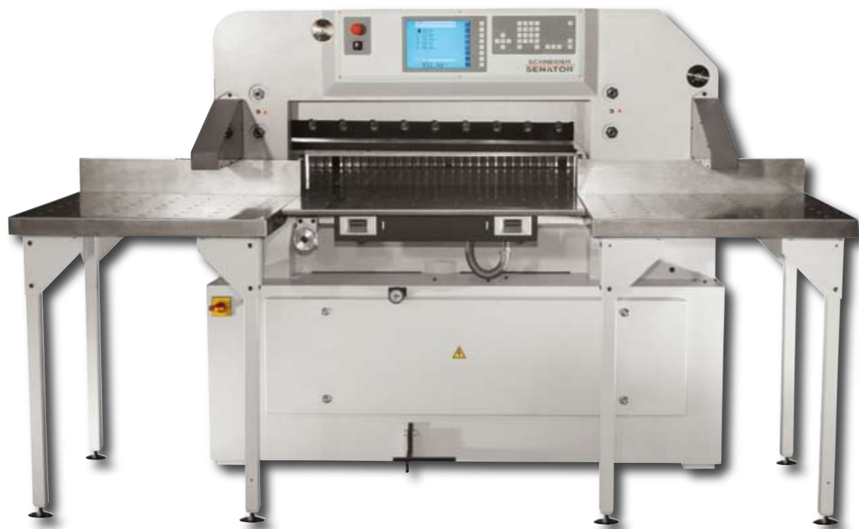
La imagen muestra la máquina, incluyendo las mesas laterales con película de aire LST 750 con superficie de acero inoxidable.